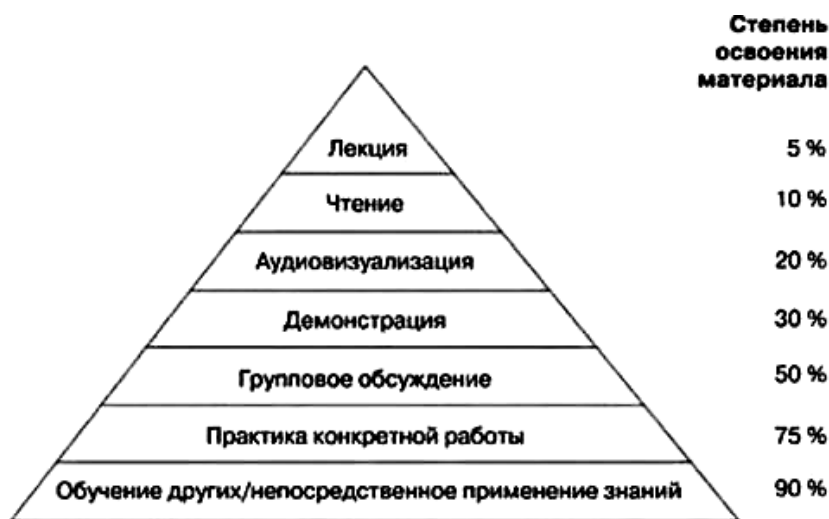
Рис. 1. Пирамида обучения Джиган Майстер

В частности, «пирамида обучения» Джиган Майстер (исследование Национального тренингового центра США) наглядно доказывает, что степень освоения материала существенно повышается при использовании в обучении практических приемов конкретной работы и возможности непосредственного применения знаний (рис. 1).